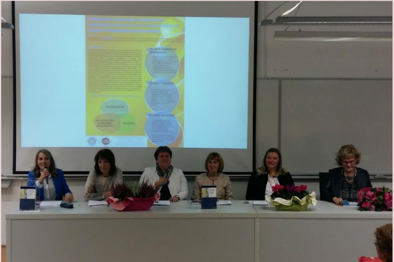
1. Stručno-znanstveni skup „Biblioterapija u odgojno-obrazovnom radu“