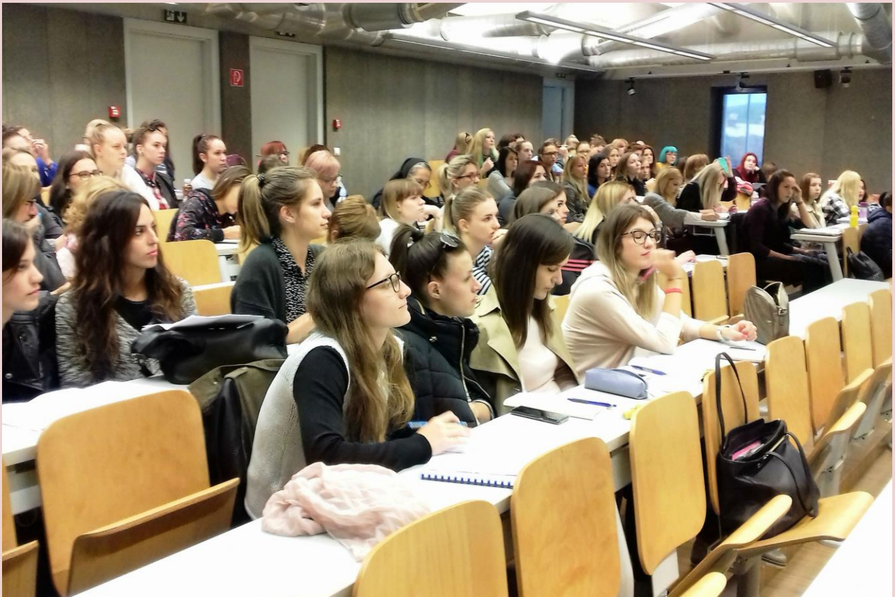
Predstavljanje knjige "Profesionalni razvoj učitelja: status, ličnost i transverzalne kompetencije"