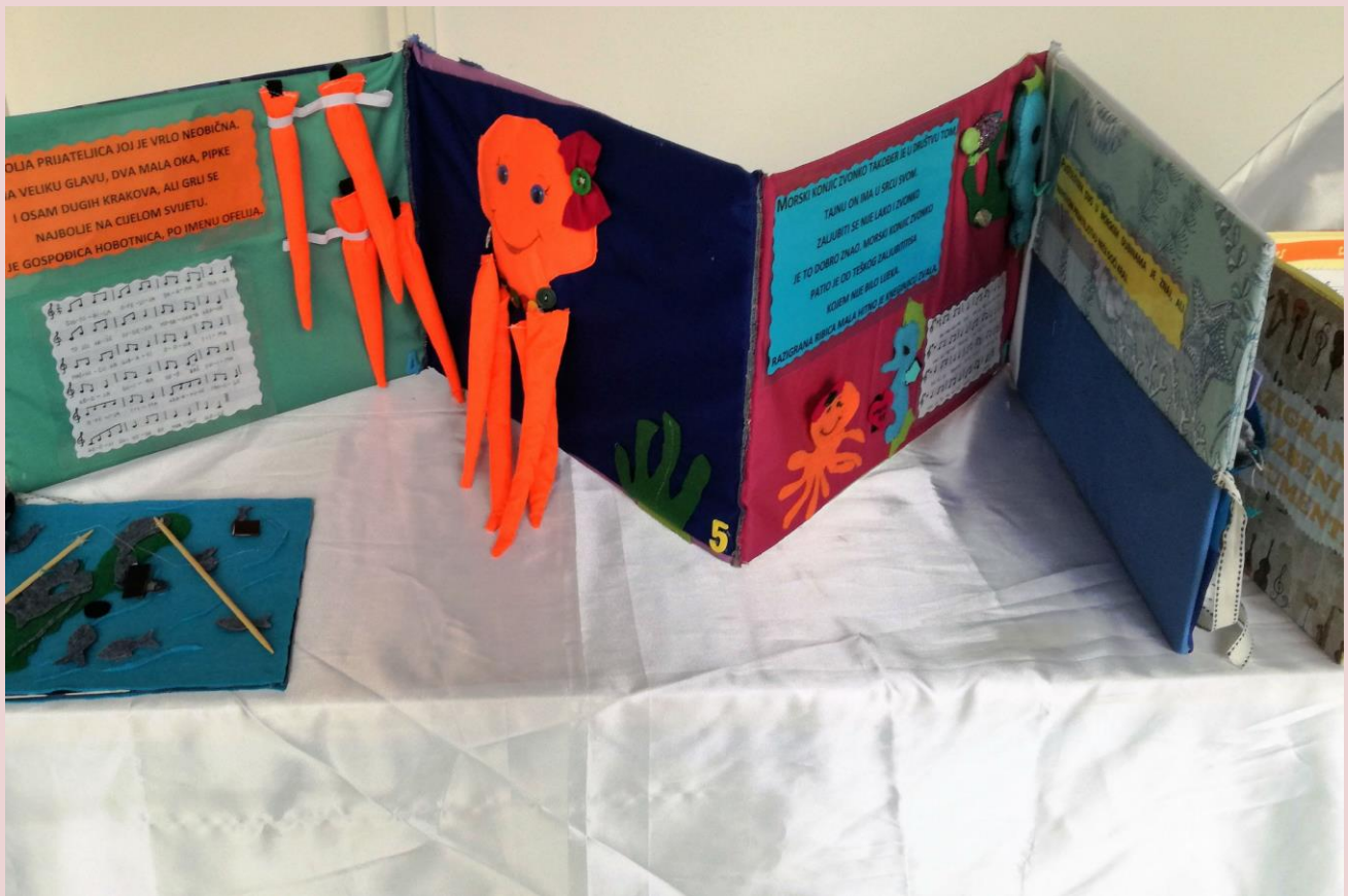
Izlaganja u sklopu Festivala diplomskih radova s međunarodnim sudjelovanjem studenata